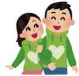
結婚式を考えている方