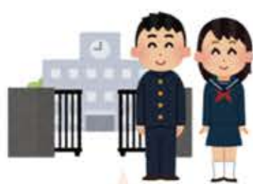
子どもの卒業式、成人式の準備を考えている方