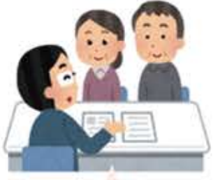
終活やお葬式の話を知りたい方