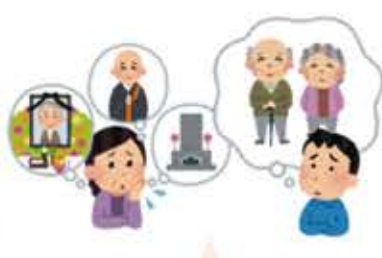
お葬式の資金や準備を心配している方